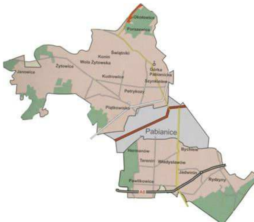
Rysunek 1 Położenie gminy Pabianice

Na rysunku 1 przedstawiono położenie gminy Pabianice.